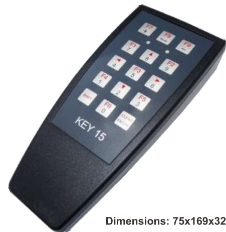
Dimensions: 75x169x32 mm

Two AA batteries will provide a long service.