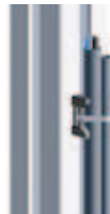
Kreuz-Kabelbinderblock Cross Cable Binding Block